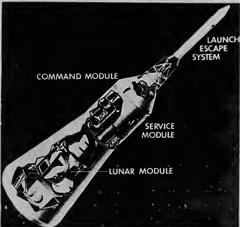
Den e parti pintá riba e grafica aki, e "Command Module", e tres astronautan tabata ora qu e candela a sorpresa nan. E viahe qu nan tabata pa realiza otro luna, tabata pa dura dos siman.